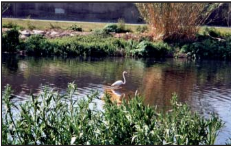
Una imatge del flamenco del riu Besòs.