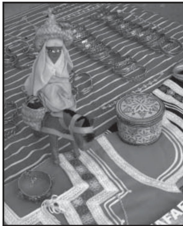
La Fira Solidària de Sant Adrià reflexionarà sobre la pau.

Dijous, 3 d'abril , a les 16 hores, a la sala d'actes de la Biblioteca de Sant Adrià, xerrada inaugural de les XI Jornades Solidàries a càrrec de Federico Mayor Zaragoza, president de la «Fundación Cultu-