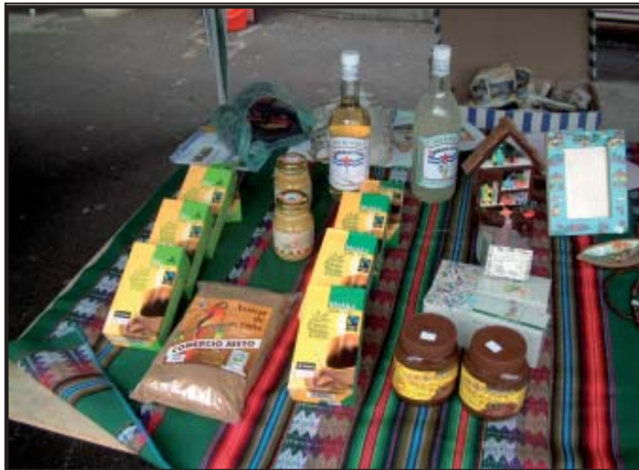
Els productes de comerç just tindran el seu protagonisme a la XI Fira Solidària.

Sant Adrià. - Del 3 al 24 d'abril es portaran a terme les XI Jornades Solidàries organitzades pel consistori adrianenc amb la col·laboració de les entitats solidàries de la ciutat i sota el lema «La pau, responsabilitat de tothom». Serà precisament la jornada inicial la més atractiva dins el calendari d'actes gràcies a la presència de l'ex-director de la Unesco, Federico Mayor Zaragoza, actual president de la «Fundación Cultura de Paz» que serà l'encarregat de pronunciar la conferència inaugural de les jornades, que ja hauran començat amb una exposició al Polidor del Comitè Català pel Sàhara sota el títol «Drets Humans al Sàhara Occidental» (de l'1 al 15 d'abril).