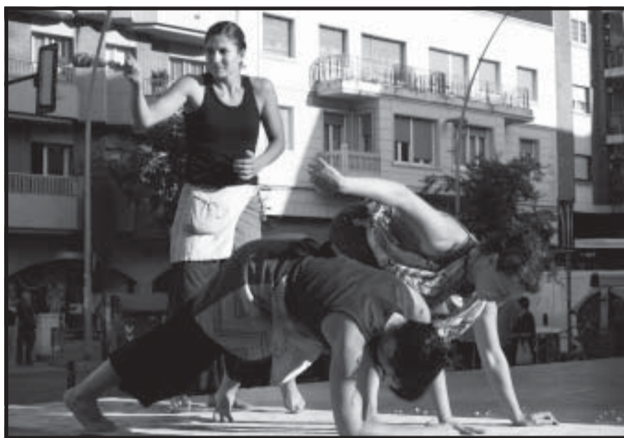
Una imagen de la primera edición del FAC adriánense.

Las bases y la ficha de inscripción pueden bajarse en la página web del Ayuntamiento de Sant Adrià