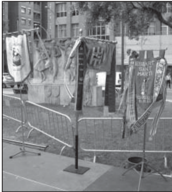
Debate sobre el monumento de la sardana.

Los argumentos de las entidades del barrio del Besòs para que el monumento se ubique en